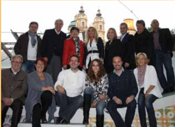
Sponsoring der Melker Sommerspiele

Wir freuen uns auf jeden Fall schon auf die Vorstellungen im nächsten Jahr!