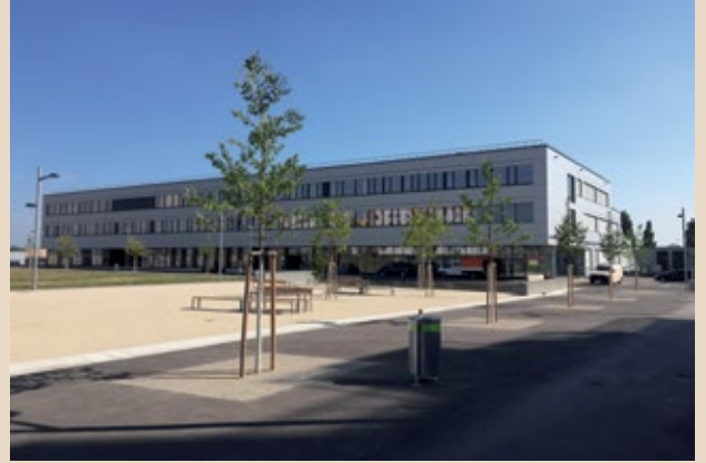
Bildungscampus Aspern Seestadt

*Anmerkung zu Gender: Wegen der leichteren Lesbarkeit wurde auf geschlechtsspezifische Formulierungen verzichtet. Die verwendete Form beinhaltet die weibliche und männliche Form gleichermaßen.