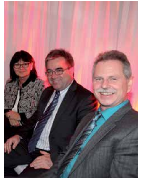
Freunde der Familie durften natürlich auch nicht fehlen