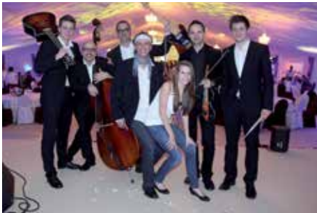
Die Band »a Hearz & a Sööh«