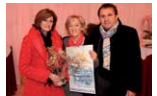
Künstler Erwin Kastner entwarf die Rückwand der Kantine, den Engel im Eingangsbereich sowie sämtliche Bilder im Haus