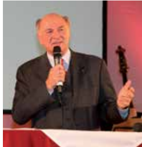
Ansprache von Dr. Erwin Pröll